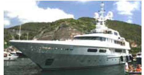
Superyacht an der Cote d'Azur — sehr exklusiv!