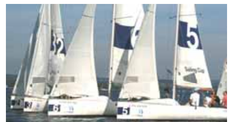
Einheitsklasse beim Regattastart— Spannung