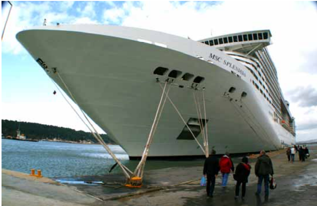
Für die wirklich große Gruppe — bis zu 4000 Gäste bzw. Teilnehmer können hier „incentivieren“ und Tagen