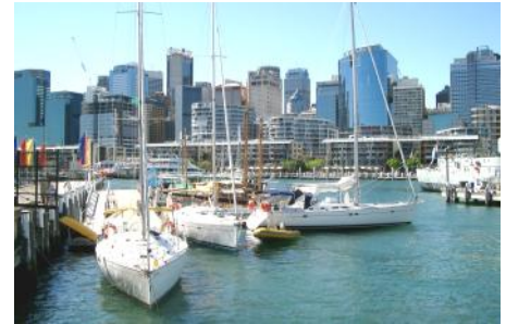
Sydney - Charterstützpunkt vor der Skyline